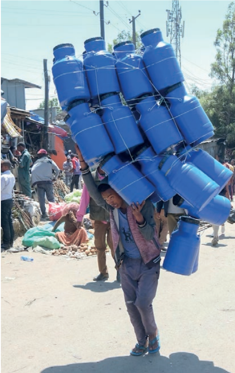
Bra arbetsmiljö är ett viktigt mål för det fackliga utvecklingsarbetet.